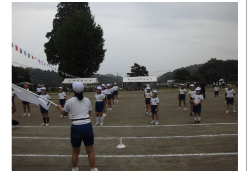
〔昨年度の運動会の様子〕

9月29日(日)の秋季大運動会に向けて、本校では連日、運動会の練習に各学年や全体で取り組んでいます。全体練習では、熱中症対策に万全を期す中、全員が入場行進や準備運動(ラジオ体操)、運動会の歌等の練習に精一杯取り組む様子が見られ、とても感心しました。一人一人が目標をもって取り組み、目標達成に向けた努力の過程を教師や保護者がしっかりと認めてあげることで、達成感を味わわせるようにしたいと思ひますので、ご家庭での温かい励ましや労いの言葉掛けをよろしくお願いいたします。